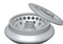
WIRNIKI HORYZONTALNE SWING-OUT ROTORS